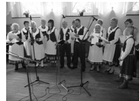
„Jugowianki” w czasie sesji nagraniowej

Od 2004 roku Polskie Radio Wrocław emituje w każdą niedzielę, w godzinach 7.00-10.00 audycję „Lista Ludowych Przebojów”. Uczestniczą w niej różne amatorskie zespoły ludowe, kapele folklorystyczne i koła gospodyń wiejskich. Wykonują tradycyjne dla danego regionu pieśni ludowe. Zespoły te konkurują o głosy słuchaczy radiowych. Od stycznia do marca 2012 roku, w tej audycji bierze udział Koło Gospodyń Wiejskich z Jugowa. Nasze panie i panowie wykonują kilka piosenek i pieśni, które wcześniej zostały nagrane przez prowadzących audycję dziennikarzy. Nasze Koło może wygrać tą edycję, jeżeli w ciągu trzech miesięcy zbierze ok. 3,5 – 4 tys. głosów radiosłuchaczy. Głosy można oddawać wysyłając na numer 72280 esemes z hasłem „ RWKapela Jugowianki ”, bądź dzwoniąc pod numer +48 71/ 339 90 60 w czasie trwania audycji. Serdecznie prosimy wszystkich posiadaczy telefonów komórkowych o głos na nasze „Jugowianki”.